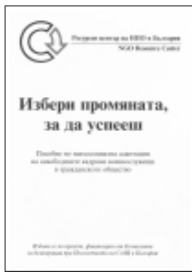
Брошурата може да получите в Центъра за социална адаптация и преквалификация – София на ул. “Шейново” № 23.

До края на 2000 г. ще бъдат разкрити центрове в Пловдив, Велико Търново и Сливен.